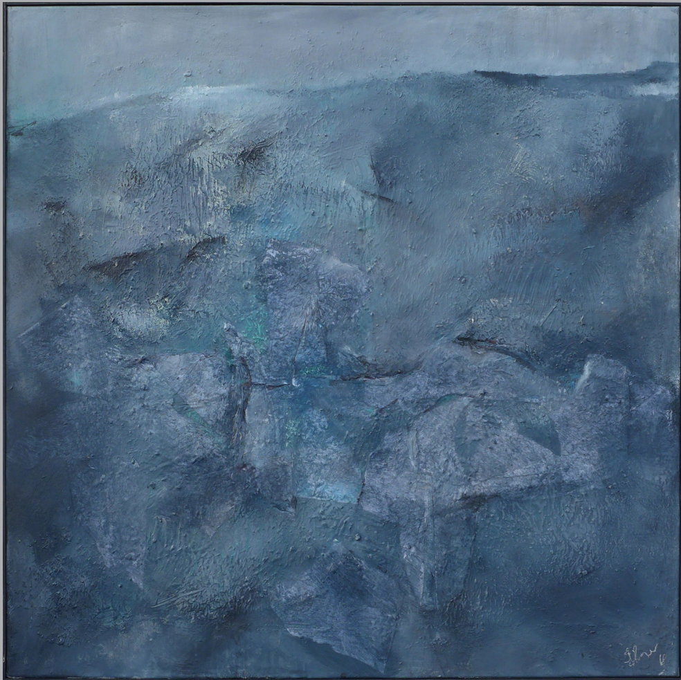
Felsiges 100 x 100cm Mischtechnik 2018