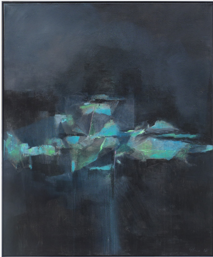
Commedia dell'arte 100 x 120cm Mischtechnik 2018