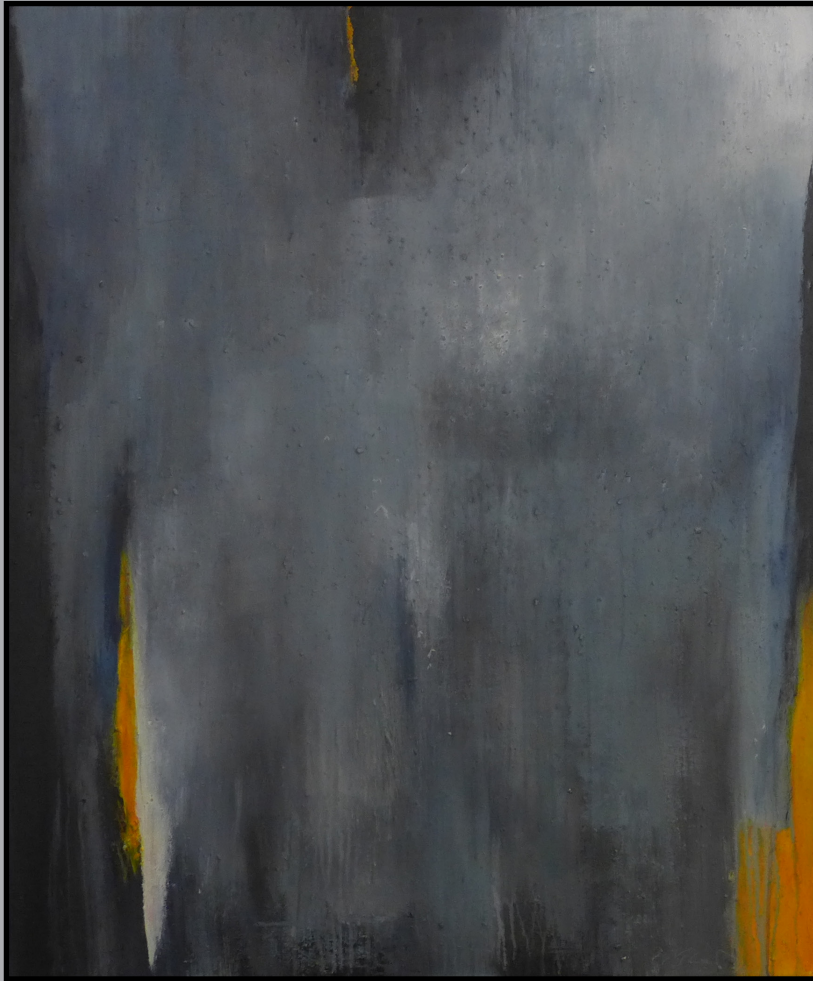
Orange Präsenz 100 x 120cm Mischtechnik 2019