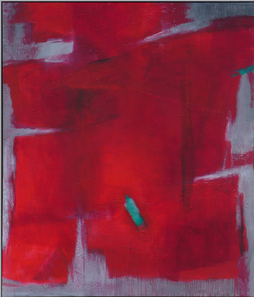
Grün im Rot 120 x 140cm Mischtechnik 2018