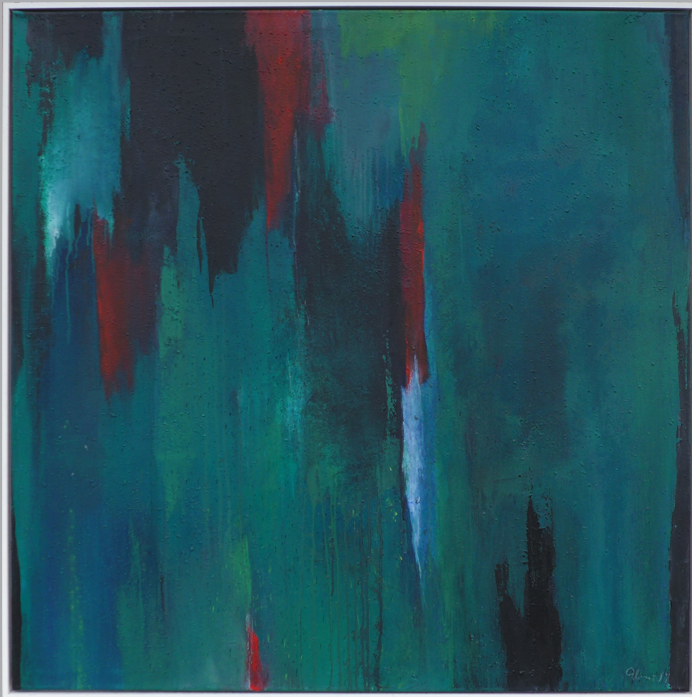
Grüne Verwerfung 120 x 120cm Mischtechnik 2019