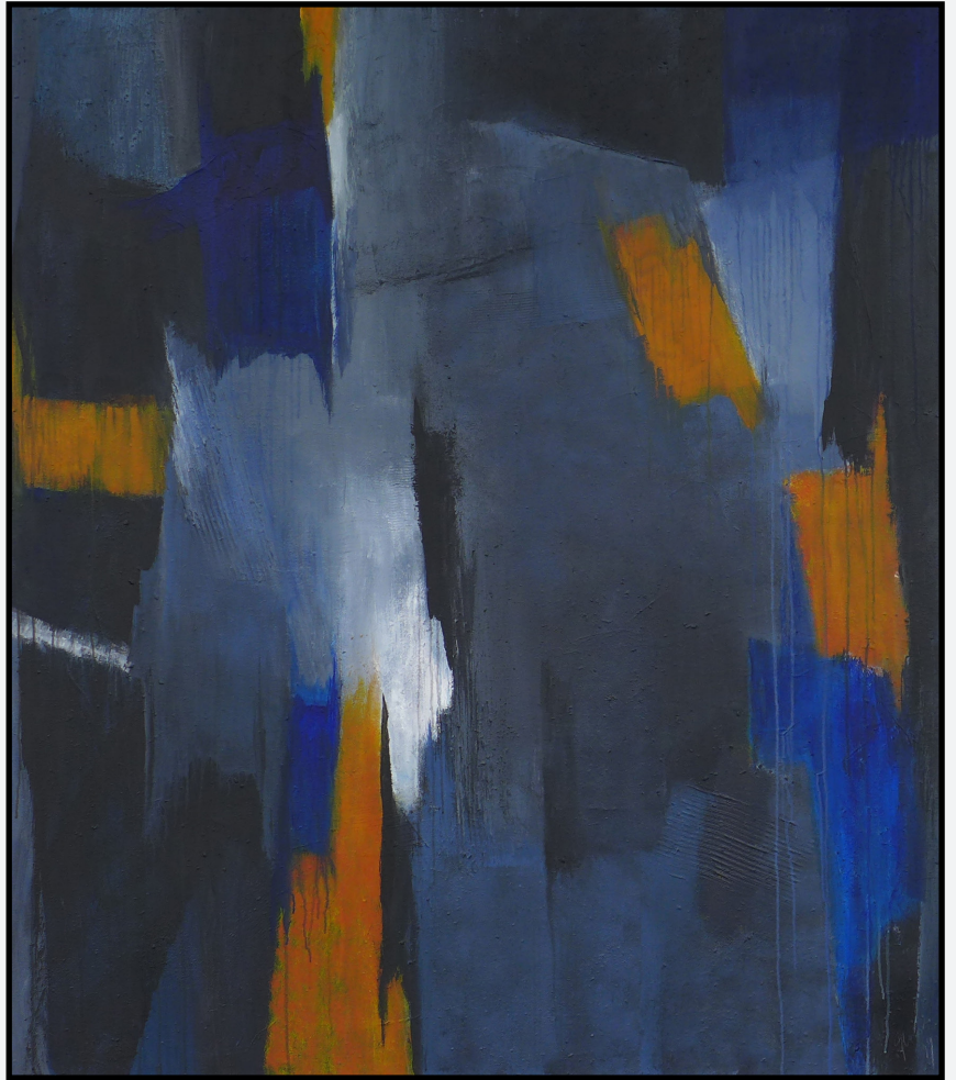
Volière 140 x 160cm Mischtechnik 2019