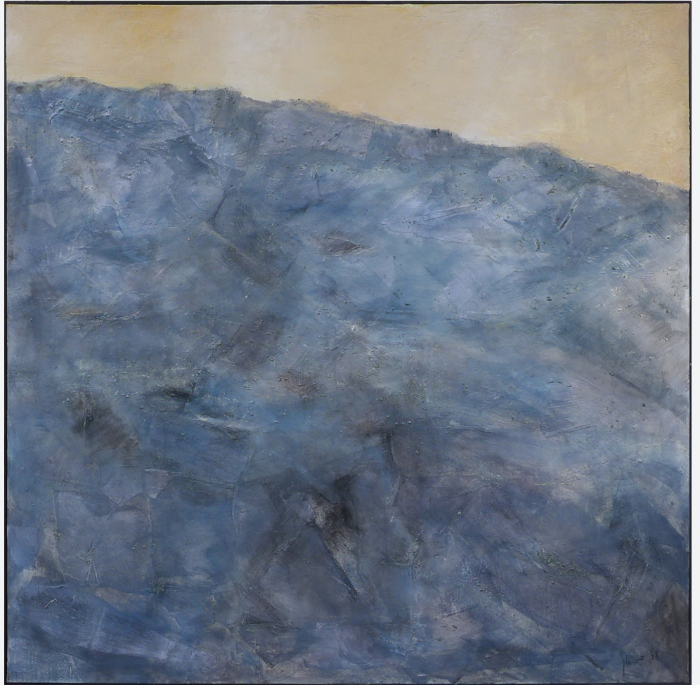
Steiniges 140 x 140cm Mischtechnik 2018