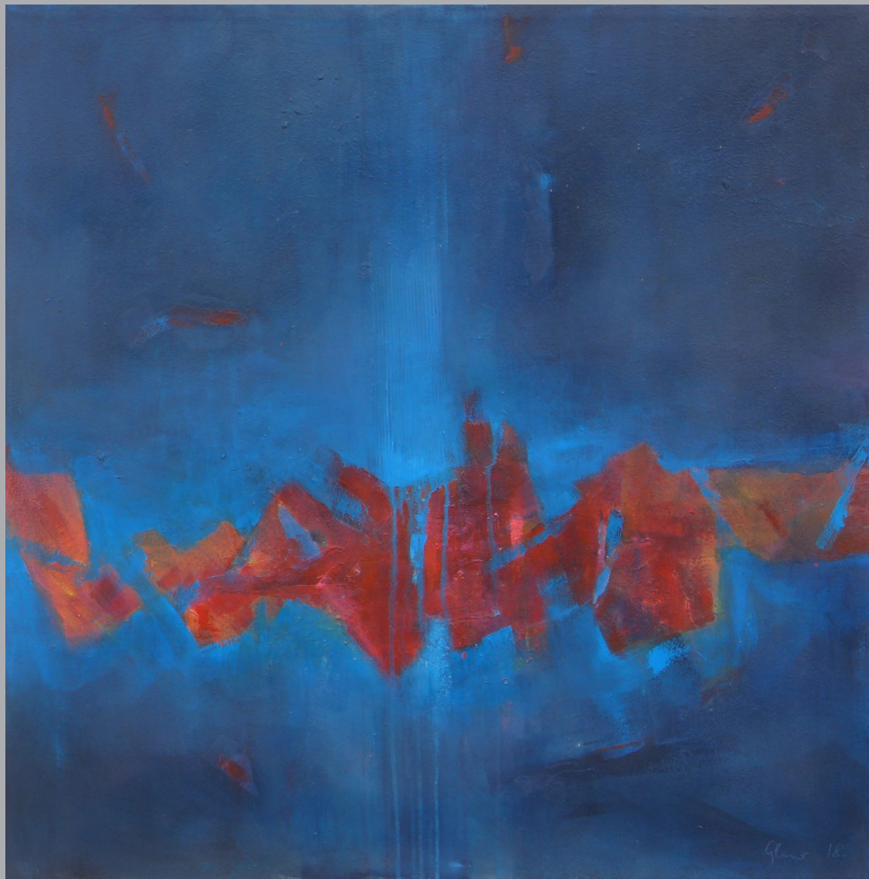
Rumpelstilz 100 x 100cm Mischtechnik 2018