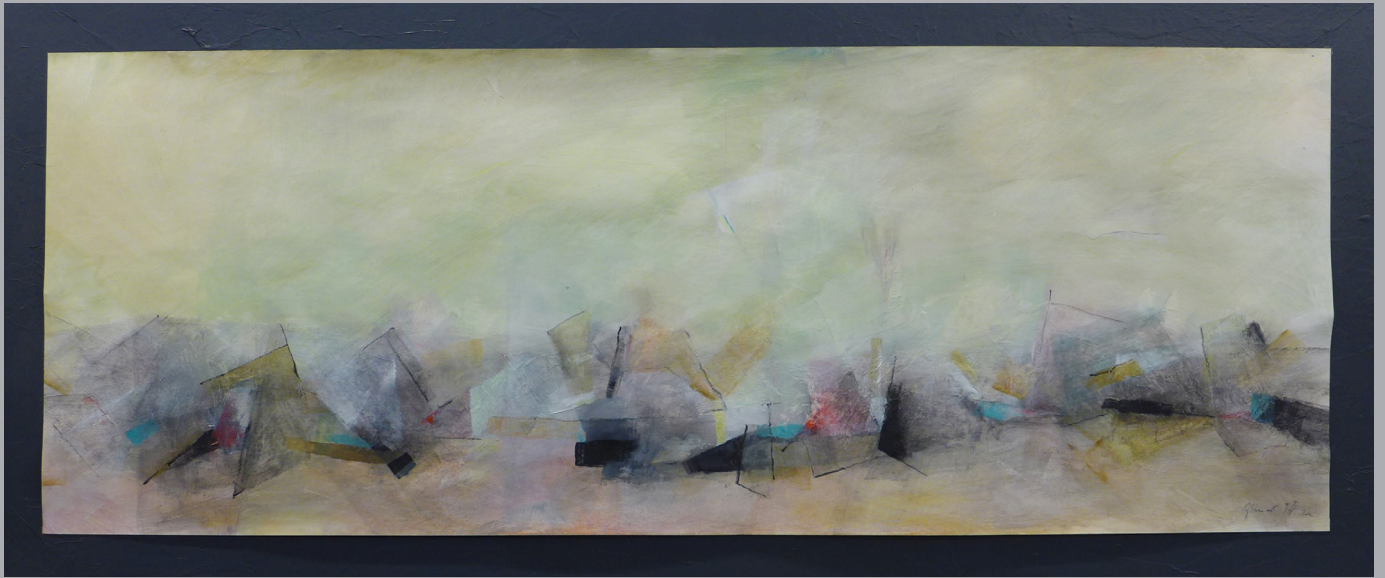
Berlin II 62 x 147cm Mischtechnik auf Papier 2017