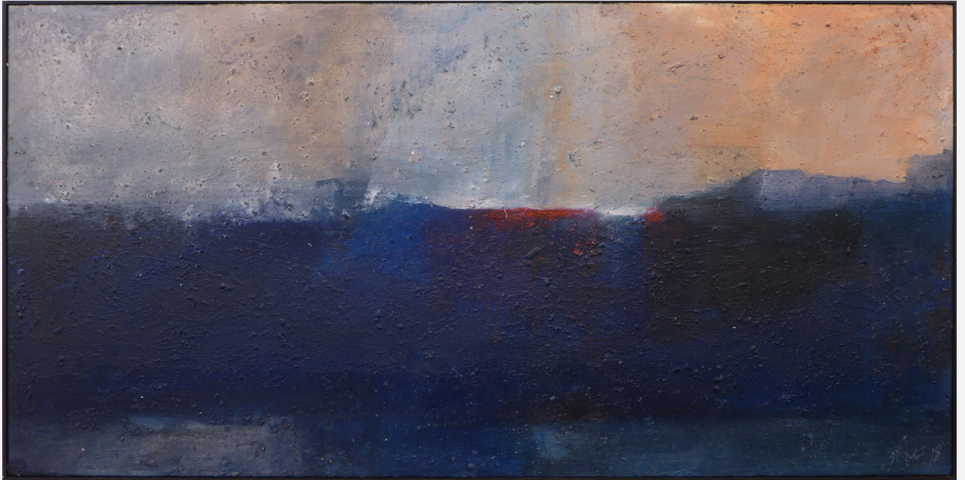
Landschaft 60 x 120cm Mischtechnik 2018