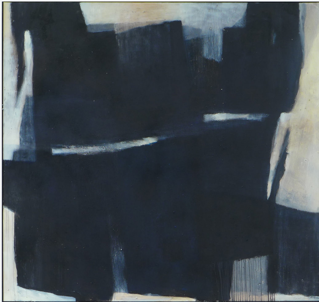
Mittelalter 150 x 160cm Mischtechnik 2018